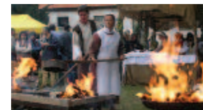
La Corte Medioevale

RIEVOCAZIONE STORICA ANTICHI MESTIERI domenica 24 tutto il giorno a cura dall'Associazione Culturale "La Corte Medioevale"