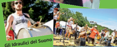
Gli Idraulici del Suono