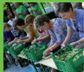
Gara di sgranatura